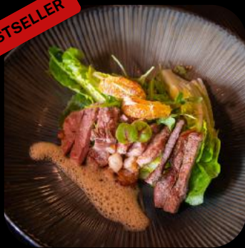
23 | Ponzu Beef Salad 13.0 D,M

Gegrilltes Roastbeef, Orange, Rucola, Kirschtomaten Romanasalat, Trüffel-Ponzu