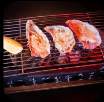
28 | Oyster Love 12.0 G,N

Gegrillte Austern getoppt mit Schmelzkäse