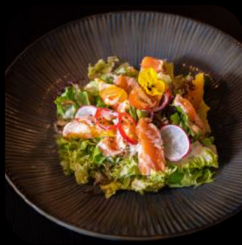
24 | Sake Retasu 13.0 C,D,G,M

Gegrilltes Roastbeef, Orange, Rucola, Kirschtomaten Romanasalat, Trüffel-Ponzu