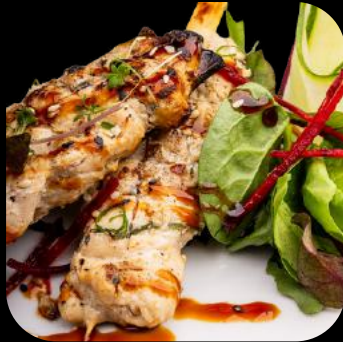
20 | Chicken Yakitori 7.0 D,M,L

Gegrillte Hähnchenspieße mit Teriyaki Sauce