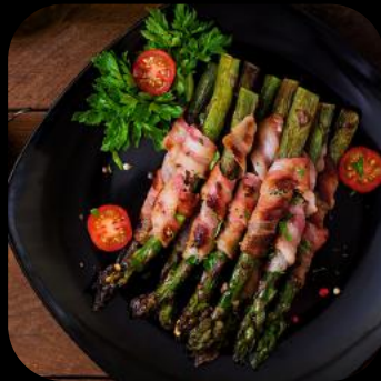
27 | Bacon Asparagus 11.0