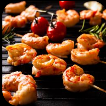
21 | Ebi on Fire 12.0 A,D,E,L,M

Gegrillte Hähnchenspieße mit Teriyaki Sauce