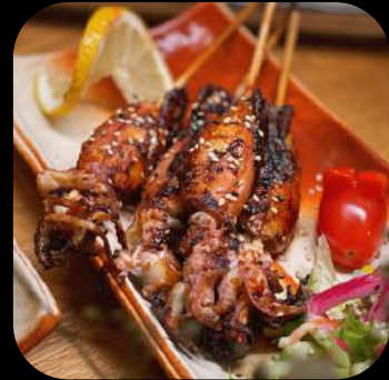
22 | Calamari on Fire 12.0 D,L,M,N