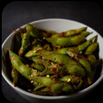
26 | Cheesy Edamame 9.0 C